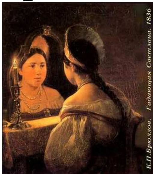
К.П. Брюллов. Гадаящая Светлана. 1836

Рождество... Сочельник... Святки... Колядки... Эти понятия с детских лет связаны в нашем сознании с трепетным ожиданием праздника, овеяны таинственностью, однако далеко не каждому из нас понятен их глубокий смысл. Конечно, сейчас не найдешь человека, который не знал бы об исторических событиях самого Христова Рождества, ставшего точкой отсчета новой эры. А вот то, как встречали этот великий праздник наши боголюбивые предки, уже забылось, стерлось из народной памяти.